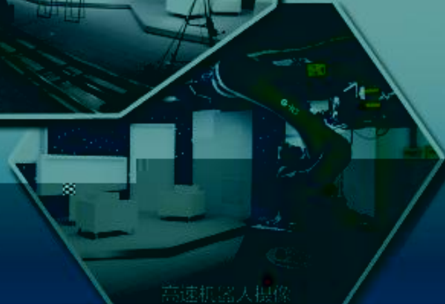
高速机器人操作室